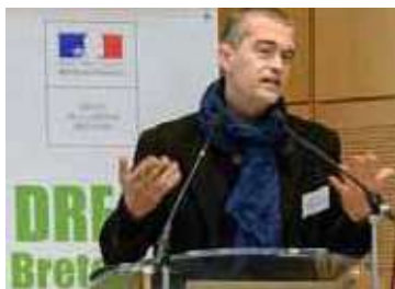
EXPOSITION L'ÉTOFFE DES VILLES - 2019 Siège Communautaire de Rennes Métropole