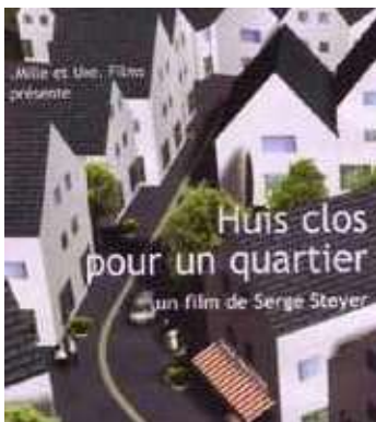
FILM DOCUMENTAIRE - HUIS CLOS POUR UN QUARTIER - 2007 de Serge STEYER (52mn) Étoile de la Scam 2008 - Cité de l'Architecture, Paris. Prix du Jury au festival Caméra des Champs 2007 Mention spéciale au festival Traces de vie 2007

À tous ceux qui aiment les villes ou les détestent, qui rêvent de les métamorphoser ou espèrent les préserver, ce livre vient rappeler que nous serons toujours plus nombreux à les habiter, à en partager les espaces et qu'il faut défendre notre droit à la parole citoyenne.